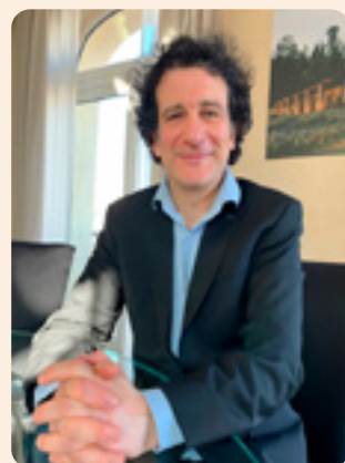
A. Altinoglu / photo: Laurent Genvo

Votre Radio ACCENT 4 sera sur place pour vous faire vivre le festival chaque soir dès 18h00.