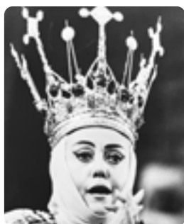
R. Crespin

La plus grande chanteuse française du 20ème siècle, soyons clairs. La beauté de la voix, la chaleur, la diction exemplaire, l'élégance, la passion, rien n'est assez pour décrire Régine Crespin. Elle a été partout fêtée et aimée : Bayreuth, New York, Chicago, Salzbourg, Londres, Buenos Aires... Un exploit : enregistrer la Walkyrie avec Solti (Sieglinde) puis avec Karajan (Brünhilde !). Elle est une reine toujours, une reine dans tout et quand elle chante en français, une impératrice.