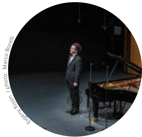
Evgeny Kissin

Lorsque l'on monte sur la Mönchsberg à Salzbourg et que l'on regarde autour de soi, la beauté des lieux vous paraît soudain plus inspirante. D'un côté s'étend le centre historique de la ville, avec son foisonnement de clochers, de l'autre côté ce sont les premiers contreforts des Alpes autrichiennes qui se déploient en un vertigineux panorama. En bas, des affiches parsèment les rues de la vieille ville : comme tous les étés depuis un siècle, Salzbourg s'est mis au diapason de son festival, l'un des plus vieux d'Europe, et déroule sa programmation exceptionnelle comme un long tapis rouge.