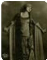
Rosa Ponselle dans la Gioconda

L'opéra est peuplé de fantômes des chanteurs qui ont marqué l'histoire du chant. Chaque émission sera consacrée à un artiste du XXe siècle (1900 à 1970), manière de portrait sonore accompagnant l'histoire parfois romanesque d'une vie, avec des photographies disponibles sur le site. En faisant un petit effort auditif, grande est la récompense : on découvre le monde merveilleux d'un âge d'or du chant et parfois de vraies références discographiques ! Une émission de Bernard Cribier diffusée le 23 octobre à 18h.