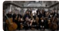
Kremerata - A. Kremer